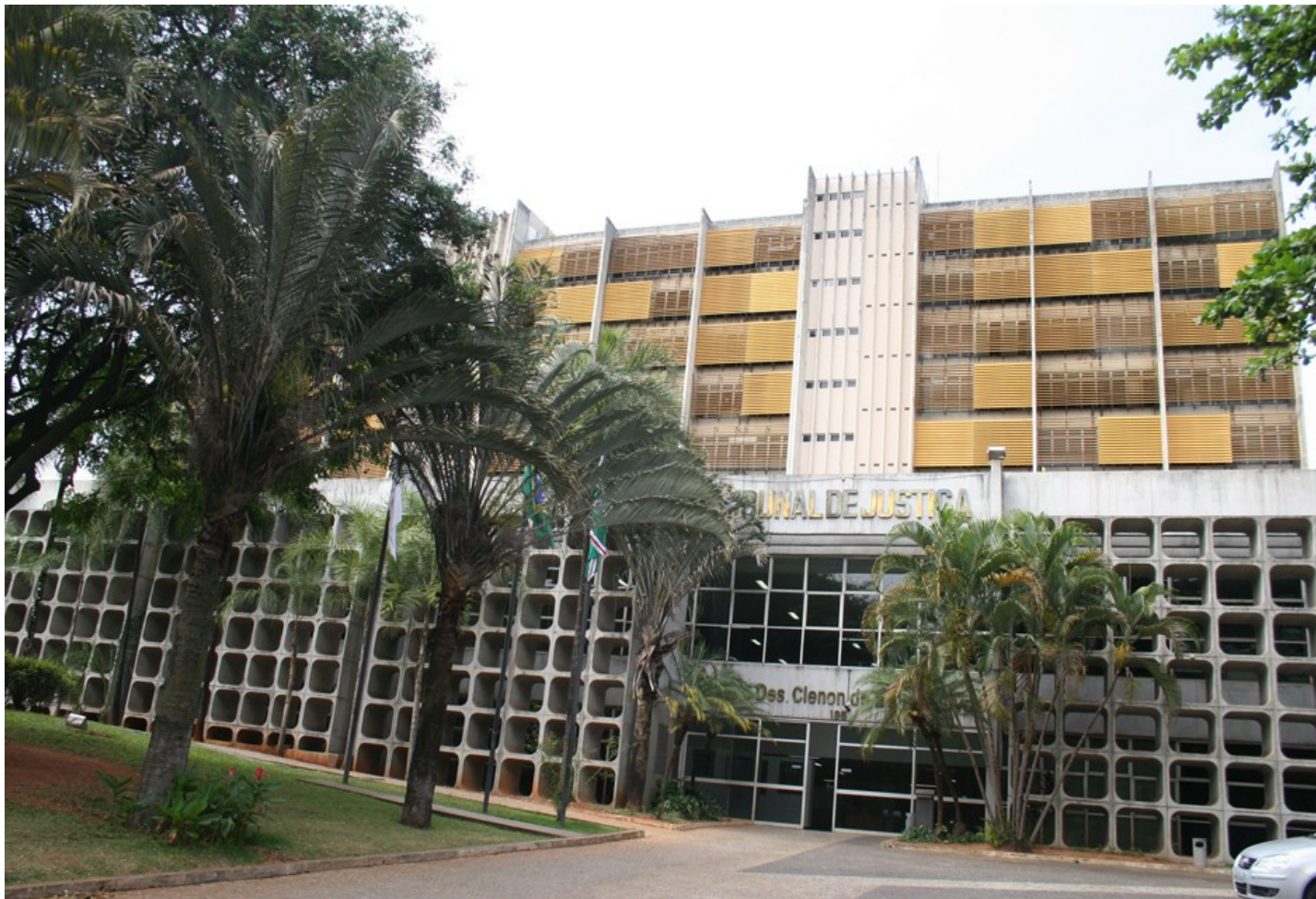
Palácio da Justiça Des. Clenon Barros de Loyola – Goiânia/Goiás