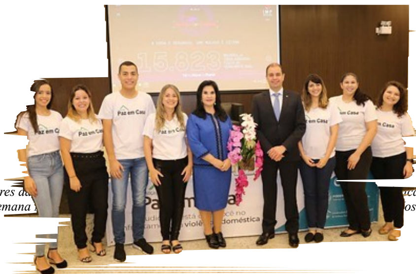
Equipe de servidores da de abertura 16ª Semana