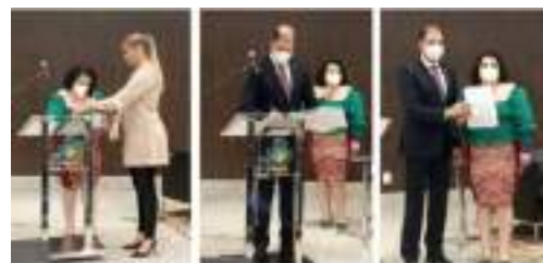
Momento da assinatura do Termo de Acordo de Cooperação entre o Comitê de Equidade e Diversidade de Gênero e o Coletivo G-Sexy

Para o juiz Vitor Umbelino, o dia 08 de março é um dia de “comemorar vitórias e avanços, mas também de lembrar da situação de inúmeras mulheres que sofrem, diuturnamente, com o fenômeno da violência”. O magistrado pontuou, ainda, que diante dos problemas da discriminação de gênero e desigualdade entre homens e mulheres, é importante estender “a reflexão sobre essa questão da igualdade de gênero não só na sociedade, mas no âmbito das nossas próprias instituições. E o TJGO dá um passo importante não só com a criação do comitê, mas com uma ação concreta no sentido da assinatura da cartilha da igualdade e respeito à diversidade de gênero”.