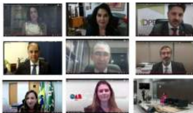
Solenidade de abertura

Teve início no dia 07 de março de 2022 a cerimônia de abertura da 20ª edição da Semana da Justiça Pela Paz em Casa, promovida pela Coordenadoria Estadual da Mulher em Situação de Violência Doméstica e Familiar de Goiás do Tribunal de Justiça do Estado de Goiás. Na oportunidade, foi feita uma homenagem ao Dia Internacional da Mulher. O evento foi realizado virtualmente, com transmissão pelo canal da Escola Judicial do Tribunal de Justiça do Estado de Goiás no YouTube e faz parte do movimento do Pacto Goiano Pelo Fim da Violência Contra a Mulher, implementado pelo governo estadual, em parceria com instituições e órgãos que integram a Rede Estadual de Proteção à Mulher, e conta ainda com o apoio do Centro Universo Goiânia.