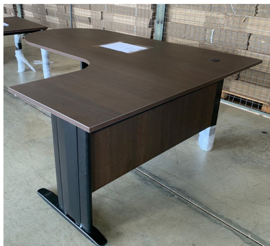
Figura 2 - Foto Mesa Peninsular vista lateral