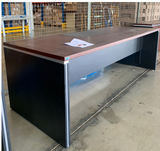
Imagem 9 - Foto Mesa Desembargador