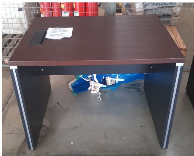
Imagem 14 - Foto Rack para Computador Desembargador

OBSERVAÇÃO 1 : - Devido a usência no mercado do MDP wenguê, ficou acordado com a empresa arrematante que as amostras seriam apresentadas em MDP de 30mm de espessura, com acabamento em lâmina natural na cor TABACO LINHEIRO, acabamento em fita de borda em lâmina natural de mesmo padrão do tampo, e acabamento em verniz de poliuretano com 5 camadas de aplicação; conforme Despacho 518 – ARQ, Evento 89. Os itens finais a serem entregues, deverão seguir a mesma especificação apresentada na amostra;