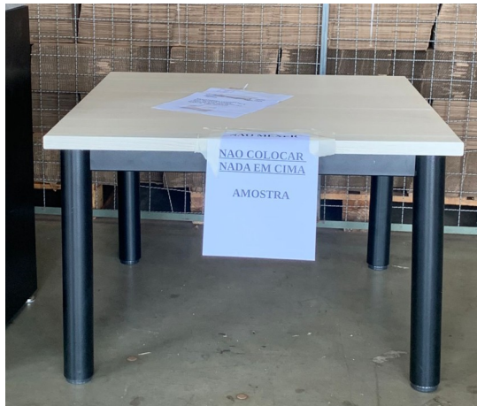
Imagem 16 - Foto Mesa Infantil vista frontal

OBSERVAÇÃO 1 : - Solicita-se a entrega final deste item com tampo na cor Cinza Cobac e Estrutura Metálica também na cor Cinza Nobac;