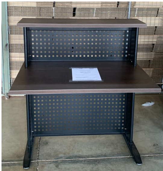
Imagem 7 - Foto balcão vista interna

OBSERVAÇÃO 2 : - Solicita-se que o tampo superior dos balcões a serem entregues, sejam alinhados ao final do tampo inferior (setas vermelhas demonstrativas). Na amostra apresentada, o tampo superior está alinhado à estrutura metálica. A fixação do tampo superior desta forma, atrapalha o uso de monitor no tampo inferior;