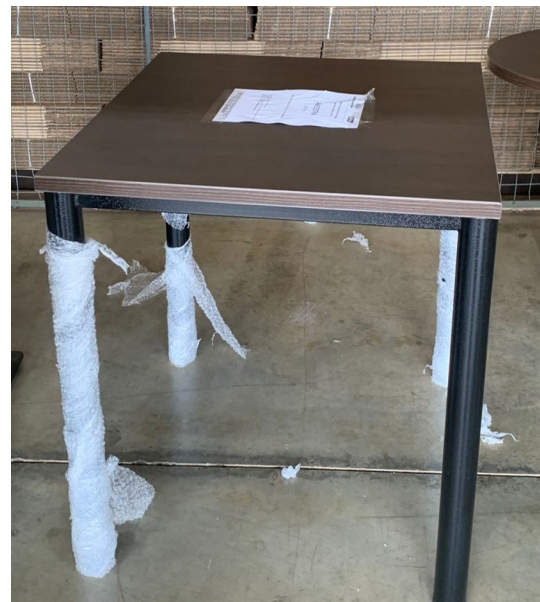
Imagem 6 - Foto Mesa Quadrada vista superior