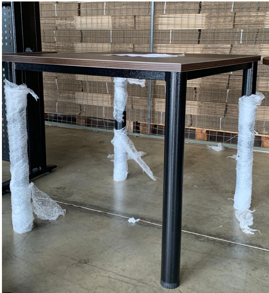
Imagem 5 - Foto Mesa Quadrada vista lateral

OBSERVAÇÃO! - Solicita-se que seja melhorado o acabamento da Pintura Epóxi Texturizada, das Estruturas Metálicas, de todas as amostras apresentadas pela empresa, conforme Figuras 3 e 4;