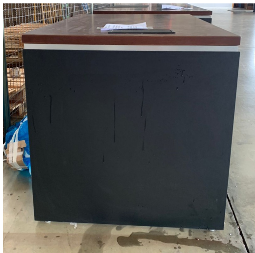
Imagem 10 - Foto Mesa Desembargador vista lateral