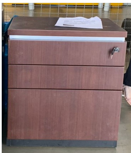
Imagem 11 - Foto Gaveteiro Volante

OBSERVAÇÃO 1 : - Devido a usência no mercado do MDP wenguê, ficou acordado com a empresa arrematante que as amostras seriam apresentadas em MDP de 30mm de espessura, com acabamento em lâmina natural na cor TABACO LINHEIRO, acabamento em fita de borda em lâmina natural de mesmo padrão do tampo, e acabamento em verniz de poliuretano com 5 camadas de aplicação; conforme Despacho 518 – ARQ, Evento 89. Os itens finais a serem entregues, deverão seguir a mesma especificação apresentada na amostra;