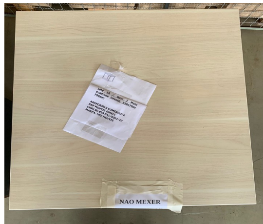
Imagem 17 - Foto Mesa Infantil vista superior