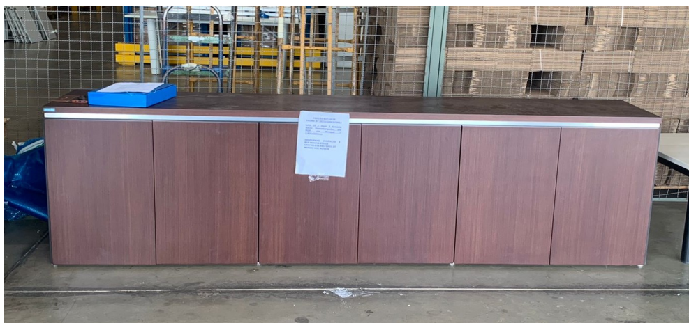
Imagem 13 - Foto Armário Baixo Desembargador

OBSERVAÇÃO 1 : - Devido a usência no mercado do MDP wenguê, ficou acordado com a empresa arrematante que as amostras seriam apresentadas em MDP de 30mm de espessura, com acabamento em lâmina natural na cor TABACO LINHEIRO, acabamento em fita de borda em lâmina natural de mesmo padrão do tampo, e acabamento em verniz de poliuretano com 5 camadas de aplicação; conforme Despacho 518 – ARQ, Evento 89. Os itens finais a serem entregues, deverão seguir a mesma especificação apresentada na amostra;