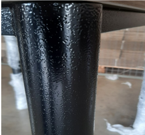
Figura 3 - Foto do Acabamento da pintura texturizada apresentada pela empresa