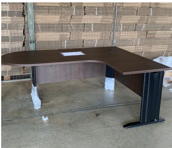
Figura 1 - Foto Mesa Peninsular vista frontal

OBSERVAÇÃO 1 : - Solicita-se que seja melhorado o acabamento da Pintura Epóxi Texturizada, das Estruturas Metálicas, de todas as amostras apresentadas pela empresa, conforme fotos abaixo (Figuras 3 e 4);