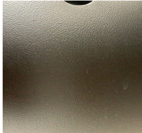
Figura 4 - Foto da Pintura texturizada ideal (que deverá ser entregue)