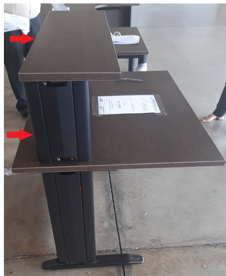
Imagem 8 - Foto balcão vista lateral