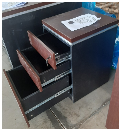
Imagem 12 - Foto Gaveteiro Volante vista lateral